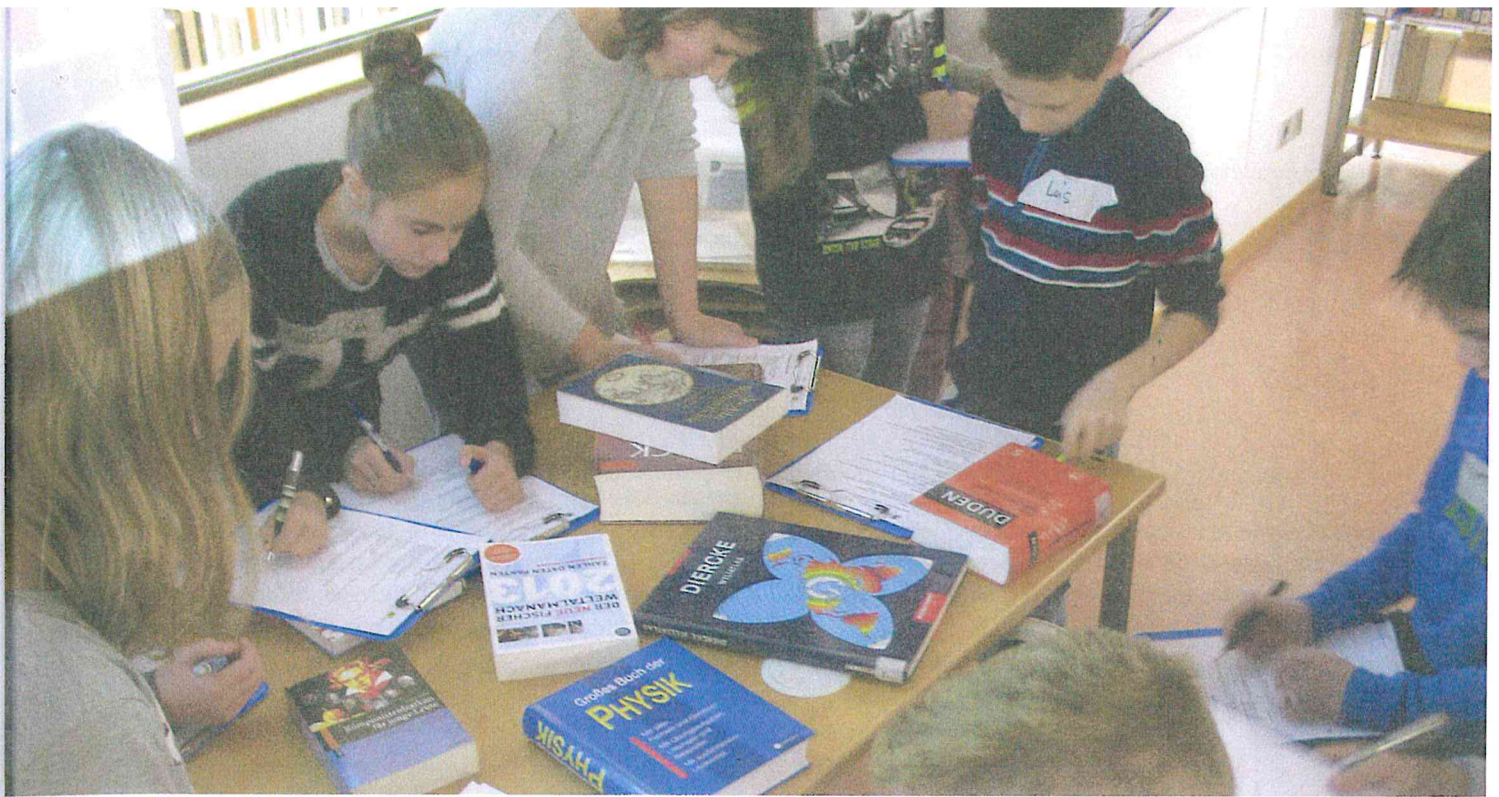
In Biberach an der Riss konnte die Stadtbücherei das Ausleihergebnis der zentralen Kinder- und Jugendabteilung deutlich steigern – nicht trotz, sondern wegen der Kooperation mit Schulen und Schulbibliotheken.